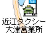
近江タクシー 大津営業所