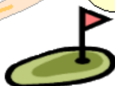
瀬田ゴルフコース

近江の国衙（こくが）跡と推定されました。国衙の中心部分の唯一の発見例として貴重。